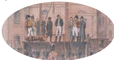
Lastuas: Bású Robert Emmet ar Shráid Thomáis, 20 Meán Fómhair 1803.

Nuair a d'oscail Príosún Chill Mhaighneann sa bhliain 1796, bhí sé ar cheann de na príosúin ba nua-aimseartha in Éirinn. Is sa tréimhse seo a tógadh an sciathán dhronuilleogach ar thaobh thiar an phríosúin.