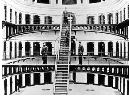
Sciathán Thoir Phríosúin Chill Mhaighneann (1860daí)