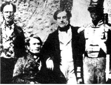
'Na hÉireannaigh Óga', c. 1848. William Smith O'Brien, ina shuí, Thomas Francis Meagher ina sheasamh ar dheis.